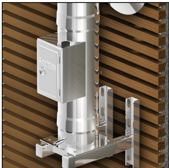
Alternativ: Prüfföffnung mit Kasten